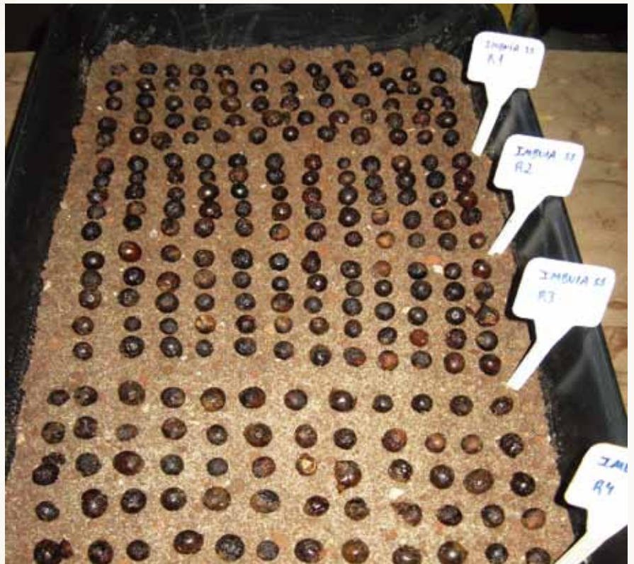
在这个试验中，为提高试验结果的可信度，对巴西胡桃木种子萌发的处理做了4次重复。

最后，通过对照试验，验证各处理间的差异是否真实。一个对照处理组的种子可以全部都是空白处理，以便与其他处理的萌发率进行对比。