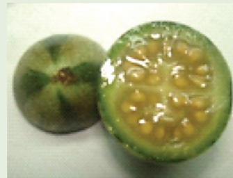
Les fruits mûrs de cette espèce ont une chair jaune et juteuse, avec des graines entièrement développées, prêtes à être récoltées