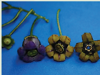
Flleurs à différents stades de maturité