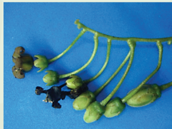
Flleurs avec de très jeunes fruits sur la même inflorescence