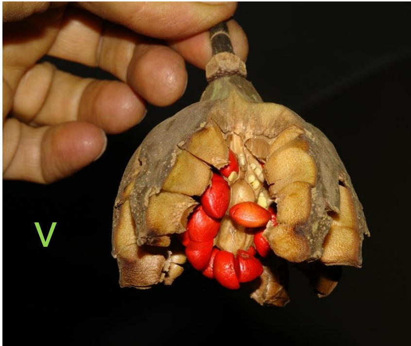
Fruto maduro, dehiscente, de Magnolia striatifolia