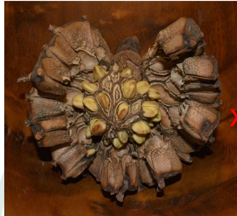
Fruto dehiscente de Magnolia neomagnifolia