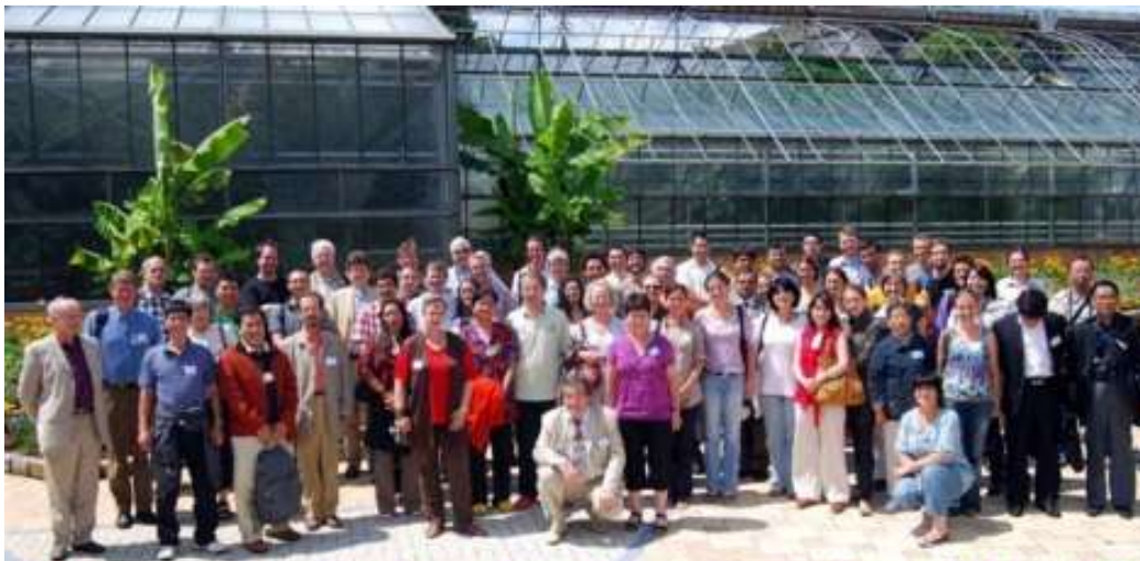
Xth International Aroid Conference, Nancy Botanical Garden, France, 8-10 July 2009

Le compte rendu de cette conférence se trouve sur notre site :