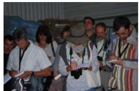
visite studieuse promoplante