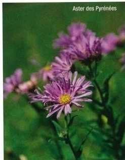
Aster des Pyrénées

Ramonde, aster, edelweiss... chacune de ces fleurs symbolise les Pyrénées. Cette exposition, orchestrée par le Conservatoire botanique pyrénéen et le Centre permanent d'initiatives pour l'environnement (CPIE) Bigorre-Pyrénées, décrypte, à travers cinq fleurs, les savoirs et les représentations que les usagers des Pyrénées associent aux plantes. ■ "Flors - À chacun sa nature, à chacun sa fleur", de fin juin à mi-octobre 2009, au Muséum d'histoire naturelle de Bagnères-de-Bigorre. Entrée : 4 €. Rens. : 05 62 91 12 05.