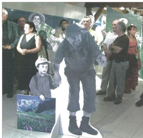
Invitation à la découverte de la flore pyrénéenne

«Flors» se déplacera ensuite du 2 au 8 novembre à la Maison de la recherche de l'Université Toulouse II - le Mirail, de décembre à janvier 2010 au Parc national des Pyrénées à Pau, de janvier à février au Jardin botanique Henri Gaussen et Muséum d'histoire naturelle de Toulouse de mars à avril à la Maison d'Parc national des Pyrénées de Luz-Saint-Sauveur, en juin au Thèmes de Bagnères-de-Luchon et fin 2010 au Musée pyrénéen de Lourdes.