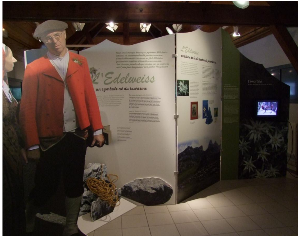
Un diaporama sur les fêtes de Laruns, et de Bielle, les aubades, les processions et les costumes ossalois où l'on épingle l'Edelweiss, anime cet espace.