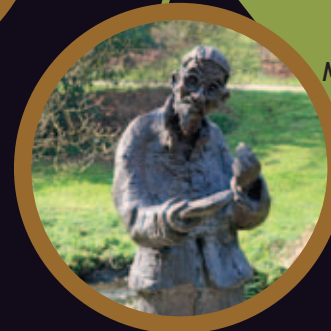
4. Monsieur Feng Shui