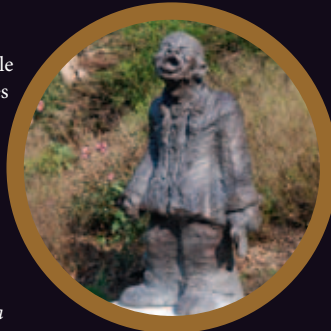
5. Le chanteur Qingqiang