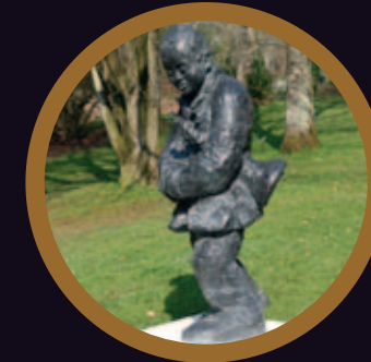
9. Le trompettiste