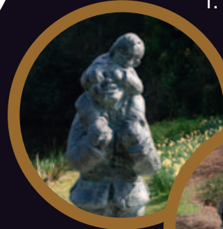
2. L'homme à petit fils sur le dos