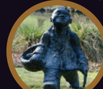
6. La cueillette des herbes