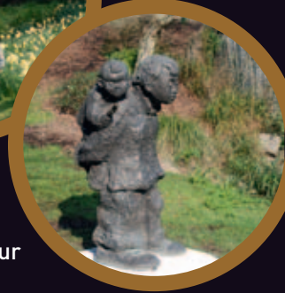
3. La petite sœur