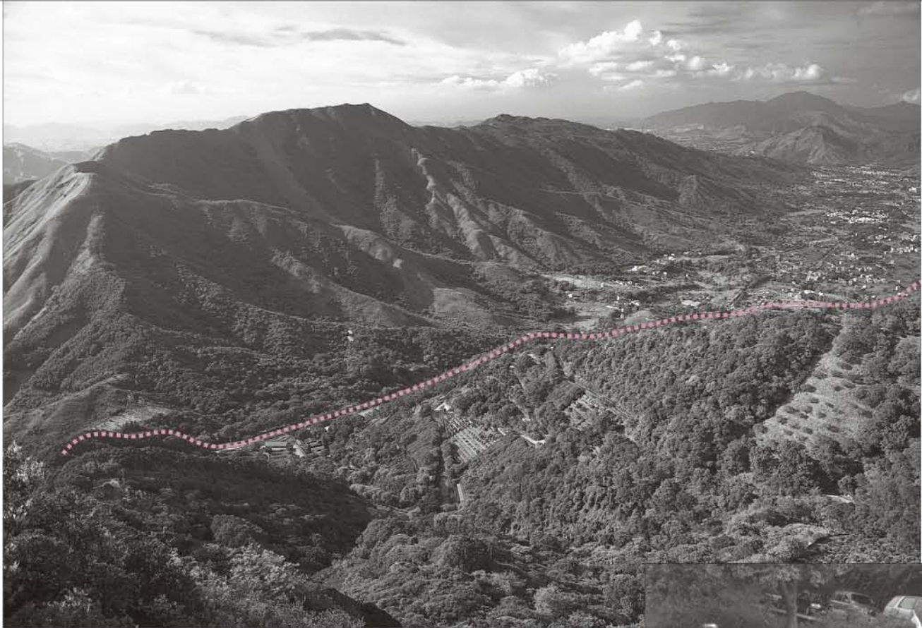
左图：本园是 庇荫着清溪、 树林、果园和 有机蔬菜梯田 的青葱翠岭 (虚线下方)