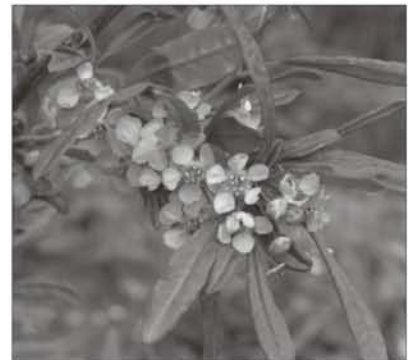
上图：在俄科院远东分院植物园的当地特有植物胡柏 ( Microbiota decussata )