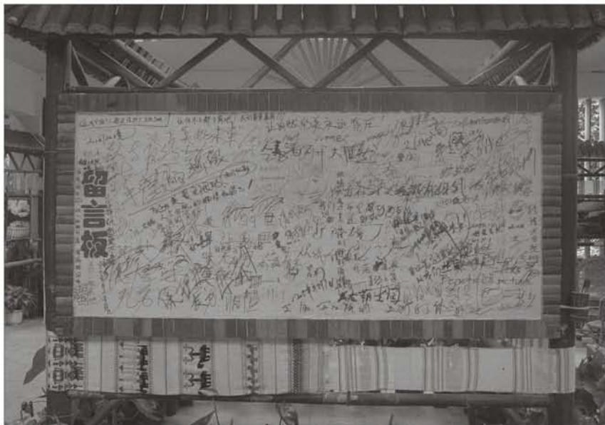
右图：参观者的留言

植物等都在展览中得到了应用，在满足展示图片的前提下充分结合地方特色、民族文化、雨林文化，取大自然之灵气，运用园林艺术、装饰艺术、行为艺术等手法，大小尺寸、比例协调、高低变化丰富，形成一定的节奏。部分展架上还布置有具有民族特色的箩、簸箕等竹器，使之既具有突出的西双版纳地方特色，又富于浓郁的少数民族风情，更融自然之趣(声、色、味、形)于一体，充分展