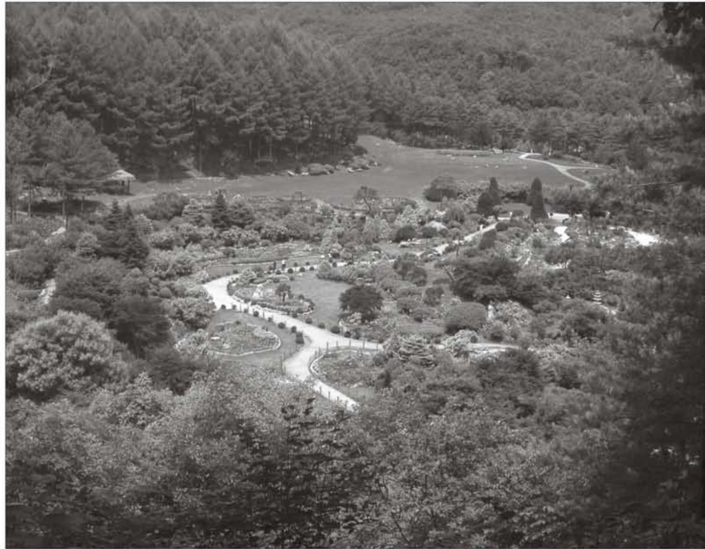
上图：京畿道省的Morning Calm花园。

其次，关于植物遗传资源的管理与交换，树木园必须努力通过可靠的树木苗圃或植物园获得植物。即使植物园经已成立，它们也应通过登记林木种子目录，积极与本地或国际植物园参与交换，计划定期交换植物的遗