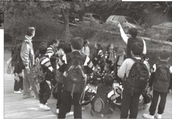
下图：本园为 本地学童安排 的游览

护理中心、昆虫馆以及两栖及爬行动物屋。通过亲近动植物和实地讲解，我们希望唤起游人对野生动植物的一份情谊和关爱，让他们设身处地把对野生动植物这份关爱同价值观、个人责任感和永续生活理念联系起来，借此缓减近代生物濒临灭绝的危机。