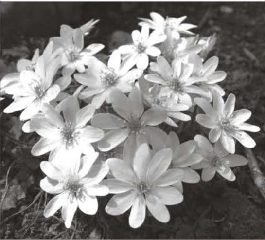
上图：在俄科学院 远东分院植物园 园内的濒危植物 耬耳细辛 ( Hepatica asiatica )

除北高加索外，南俄罗斯远东拥有的植物多样性是整个俄罗斯里最丰富的。该区包括哈巴罗夫斯克 (Khabarovsk) 一带的阿穆尔河盆地 (Amur River Basin) 和哈桑区 (Khasan) 锡霍特山脉 (Sikhote-Alin Range) 的山区，而俄罗斯滨海边疆区 (Primorskii Krai) 的南部有超过 4,000 种维管束植物。