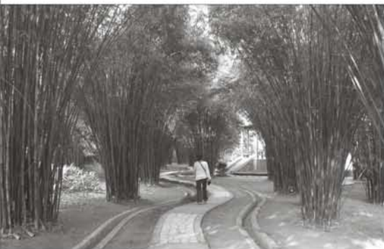
上图：湖北武汉植物园竹林

21 世纪人类面临的最重大挑战之一是如何解决对植物资源的极大需求和可持续发展之间的矛盾。植物园在保护生物多样性及其可持续发展中将发挥越来越重要的作用 (Wyse Jackson & Sutherland, 2000)。