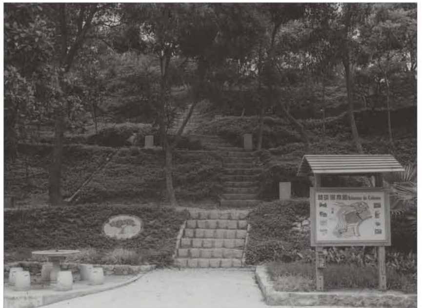
右图：路环石排湾郊野公园树木园

此园建于1994年，面积约550平方米，栽种了53种富趣味的植物，如胎生植物秋茄( Kandelia obovata )、食虫植物猪笼草( Nepenthes mirabilis )和茅膏菜、动感植物含羞草( Mimosa