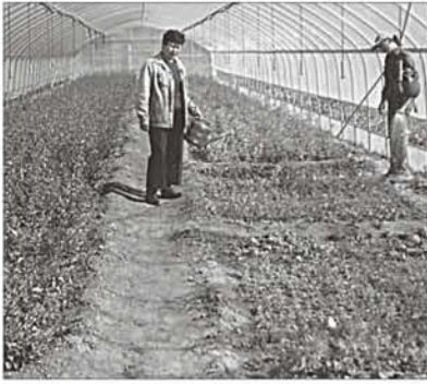
统的高潮植被、演化与转变

该所与俄罗斯、美国、日本、德国、中国和以色列等15个国家的研究所与大学合作，如俄罗斯科学院(俄科院)的A.N. Severtsov生态与演化学研究所(A.N. Severtsov Institute of Ecology and Evolution)、俄科院的科马罗夫植物研究所(Komarov Botanical Institute)、俄科院的贝加尔自然资源研究所(Baikal Institute for Natural Resources)、中国科学院(中科院)的植物研究所、中科院的生态与地理研究所；日本东京大学的植物系、日本的冈山理科大学(Okayama University of Science)、日本金泽大学的自然科学研究生院(Graduate School of Natural Science and Technology)、德国哈雷马丁路德大学的地植物学研究所暨植物园