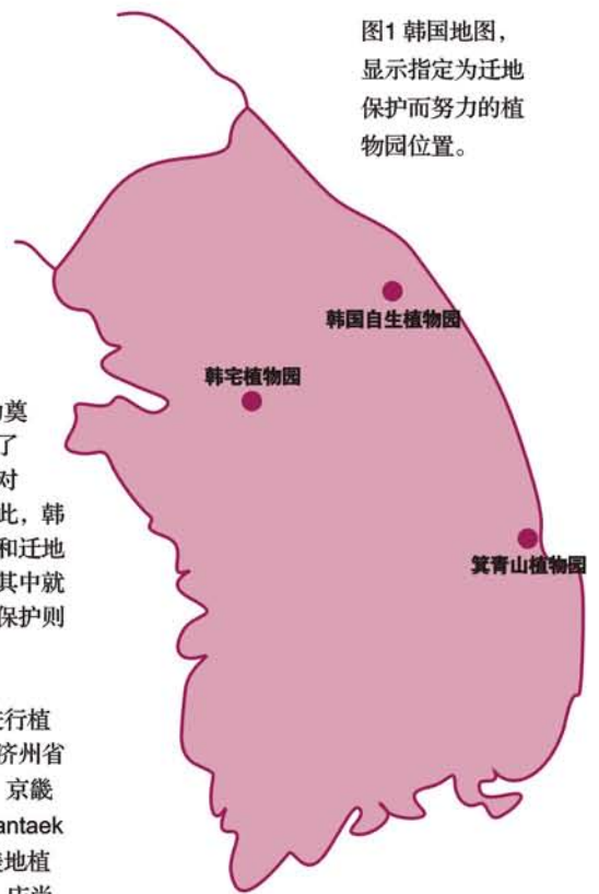
图1 韩国地图, 显示指定为迁地保护而努力的植物园位置。

韩宅植物园、箕青山植物园及韩国自生植物园都是私人植物园。韩宅植物园为植物保育和物种恢复培育以下 12 个植物物种: 山荷叶 ( Rodgersia tabularis )、三叶蕨蕨 ( Crypsinus hastatus )、山葵 ( Wasabia koreana )、鲜黄连 ( Jeffersonia dubia )、朝鲜鸢尾 ( Iris odaesanensis )、干鸢尾 ( Iris dichotoma )、八宝属的 Hylotelephium ussuriense 、木犀科的 Abeliophyllum