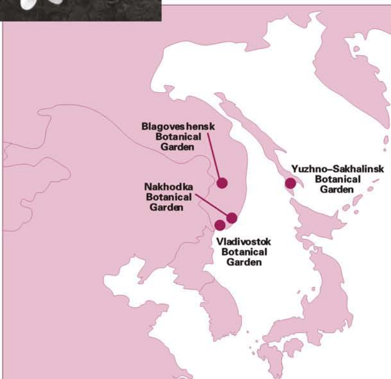
俄罗斯远东地图， 显示植物园分布

《俄罗斯联邦红皮书》(Red Book of the Russian Federation) 列出的植物差不多有一半可在南俄罗斯远东发现。植物大多生长在远东区的南部 (1988)(83 个物种，包括 6 种孢子植物和 6 种裸子植物)。这包括 24 种木本植物，如胡柏 ( Microbiota decussata )。萨哈林岛 (Sakhalin Island) 及 / 或千岛群岛 (Kuril Islands) 有大量 (83 种中的 22 种) 濒危植物。南俄罗斯远东有很多植物位处其分布区的北缘或南缘，因