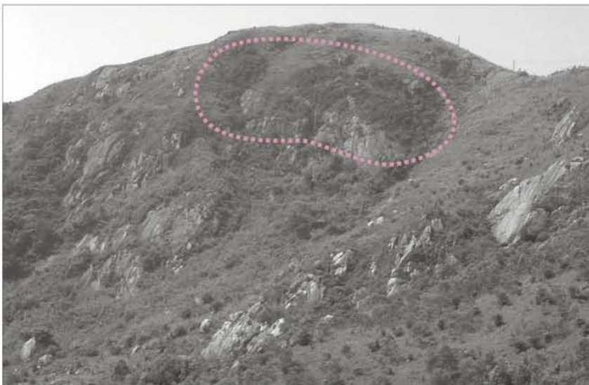
右图：位于香港特区青衣岛的香港巴豆天然生境（以圆圈标示）

为估算上述地点香港巴豆种群的总数量，我们于2005年12月进行了一次实地调查。由于从未在上述地点以外的地方发现香港巴豆，因此该处山坡的林地就是香港巴豆的典型生境。我们在林地内随机选取了3个5米×5米的区域，以划定取样地点，再进行估算。该处香港巴豆的种群数目估计约有1700棵。在调查的样本当中，分别有53%和14%正在开花和结果，