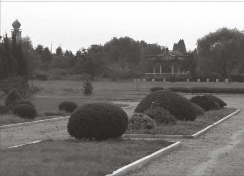
上图: 中央植物园

朝鲜民主主义人民共和国(朝鲜)的主要植物园是位于平壤大城山山脚,建于1959年的中央植物园(中央商业区秘书处 Secretariat of the CBD, 1998)。朝鲜也在每个道省和白头山(两江道省三池渊郡)附近兴建一些较小型的植物园以保育高山植物。在生物多样性重要的地区里也有其它植物园,如五家山(慈江道省的和坪郡)与瓮津(黄海南道省阳德)。至1998年,除中央植物园外,朝鲜有14所省级植物园、三个树木园和21个市级或县级花园。中央植物园旁刚在兴建占地100公顷的树木园,目的是通过收集幼苗保存2,500个植物物种。