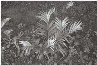
右图：扦插繁殖的台湾穗花杉 Amentolaxus formosana Li, 濒危植物, 是迁地保护的首要对象。

福山植物园隶属于台湾林业试验所，位于台湾东北部山区，占地1,097公顷，设立于1990年，并于1992年开放予民众参观。