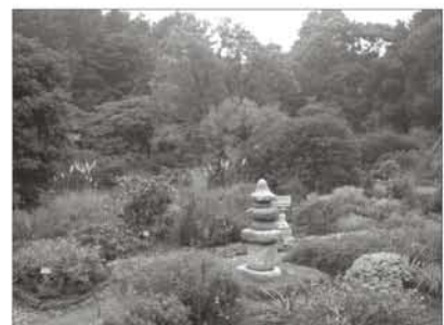
左图:Chollipo树木园。

Song Ki-Hun 韩国植物园及树木园协会 (Korean Association of Botanical Gardens and Arboreta) 秘书长 电邮: arboreta@kornet.net 地址: Wonji-dong 104 Seochu-gu Seoul 137-150 Korea 电话: +82(0)2-593-6435/02-575-6441 传真: +82(0)2-575-6441 网址: www.kabga.or.kr