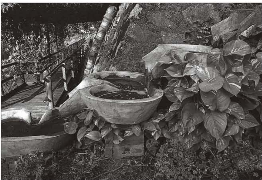
右图：人工湿地污水处理系统协助处理本园动物排出的有机废物

至于动物保育方面，我们致力协助香港的野生动物拯救和生活环境保护等工作。1994年，本园在一处山坡上广种蝴蝶喜食植物，并将之发展成户外蝴蝶园。时至今日，该蝴蝶园已成为全香港观赏蝴蝶和飞蛾的最佳地点之一。本着近距离接触的教育意念，我们设有多项教育展览，如猛禽