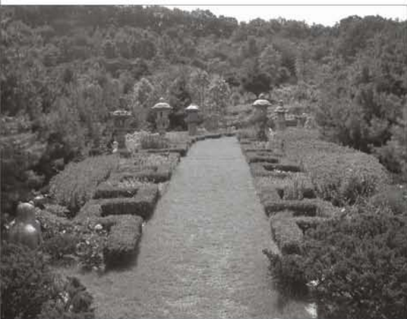
下图:忠清南道省Gowun植物园一隅。

第五、为植物来源进行的调查发现全国只有5所树木园有登记林木种子目录(Index Seminum)。在国内树木园的植物交换计划中,11所植物园曾与3所或以上树木园或植物园交换植物,另有7所依赖采购植物。有3所树木园通过与最少5所海外树木园或植物园的交换计划获得外来物种,另有3所树木园通过海外数所树木园或植物园的交换计划获得少量物种。有12所植物园从其它树木园或种子经销