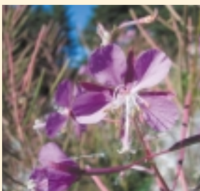
Conservation des habitats végétaux, Jardin botanique de l'Université Memorial